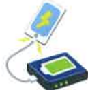
モバイル バッテリー